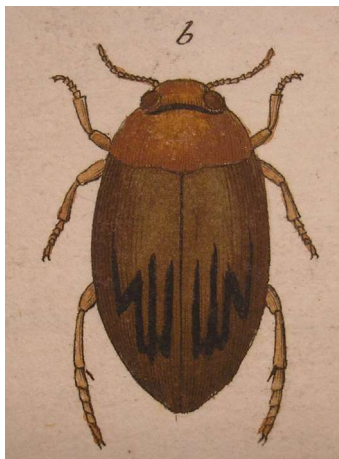
Dytiscus confluens dvs. Hygrotus confluens från Panzers Fauna Insectorum Germanicae Initia Deutschlands Insekten vierzehnten Hefts.

Här kan också nämnas att för Hygrotus decoratus (Gyllenhal, 1810), som hävdades vid Sunnersta herrgård, Nedre Föret, den 22 oktober, har man föreslagit det nya släktnamnet Clemnius .