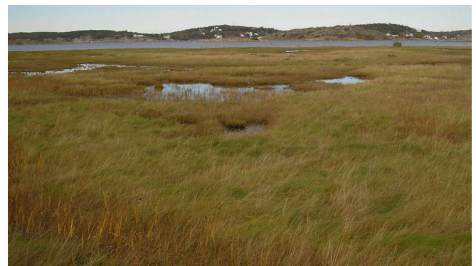
Vy mot Stallviken och strandängarna från vägen till Vallda Sandö.

Tre ex hävdades i en grund vattensamling på det inre av strandängen vid Stallvikens södra del.