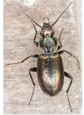
Agonum ericeti .

En art bunden till myrar och mossar, där den kan hittas löpande på mossan i solskenet. Mest funnen i trakterna mellan Väner och Vättern samt i Halland. Tidigare funnen på Nordkoster. Hittat ytterligare tre ex en vecka senare inte långt från fyndplatsen.