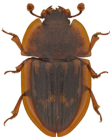
Amphotis marginata .

En sällsynt art med starkt östlig utbredning i landet, och bara ett tidigare fynd i västra Sverige på Artportalen (söder om Falkenberg). Lever som tjuv i anslutning till bon av värdarten blanksvart trämyra. Hittades i flera ex på en grov ihålig ask, tillsammans med myran.