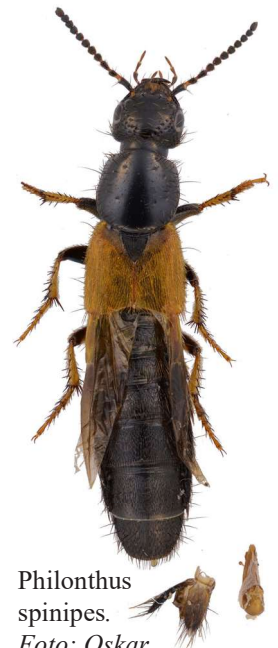
Philonthus spinipes.

Denna sällsynta kortvinge påträffades under en sten intill en av de grova ekar som växer på platsen.