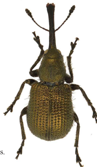
Neocoenorrhinus minutus .

En art som förekommer sällsynt längs kusten i södra Sverige, och utvecklas i eknoppar. En individ togs i fönsterfälla i en eckdominerad skogsduge inne i Göteborg.