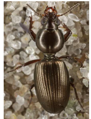
Dyschirius obscurus .

Två ex på bar fuktig sand, mellanpartiet av sandstranden. Påträffad mest i Skåne och Halland, i Bohuslän tidigare hittad på Rörö och på Koster. Arten har en matt sammetslik ovalsida, därav namnet, till skillnad från den glänsande och mer vanligt förekommande D. thoracicus .